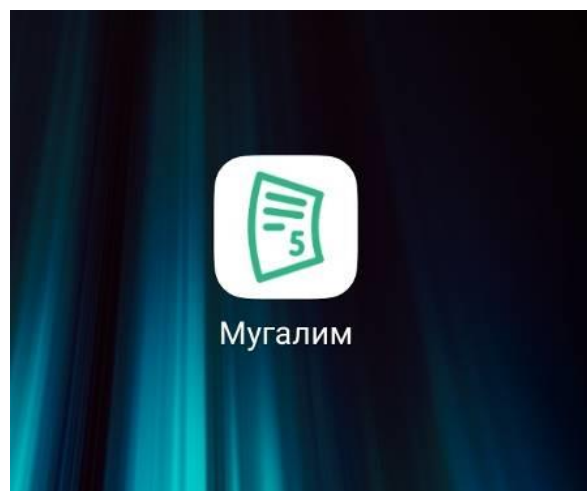
после скачивания (иконка)